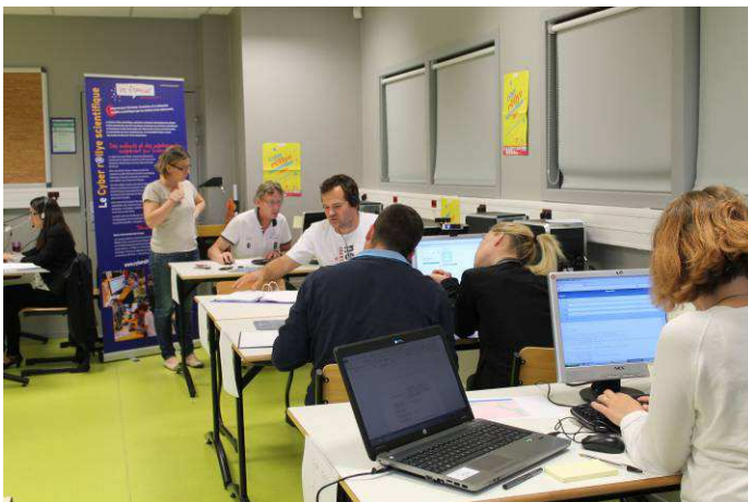
2014 à Besançon (Collège Voltaire - Doubs).