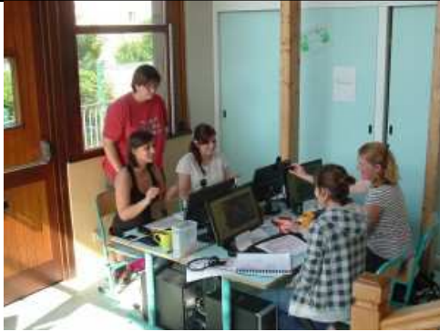
2012 à Clermont Ferrand (Centre de loisirs l'arbre aux enfants – Puy de dôme).