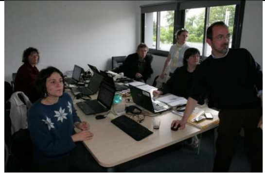
2013 à Pau (Hélioparc– Pyrénées atlantiques).